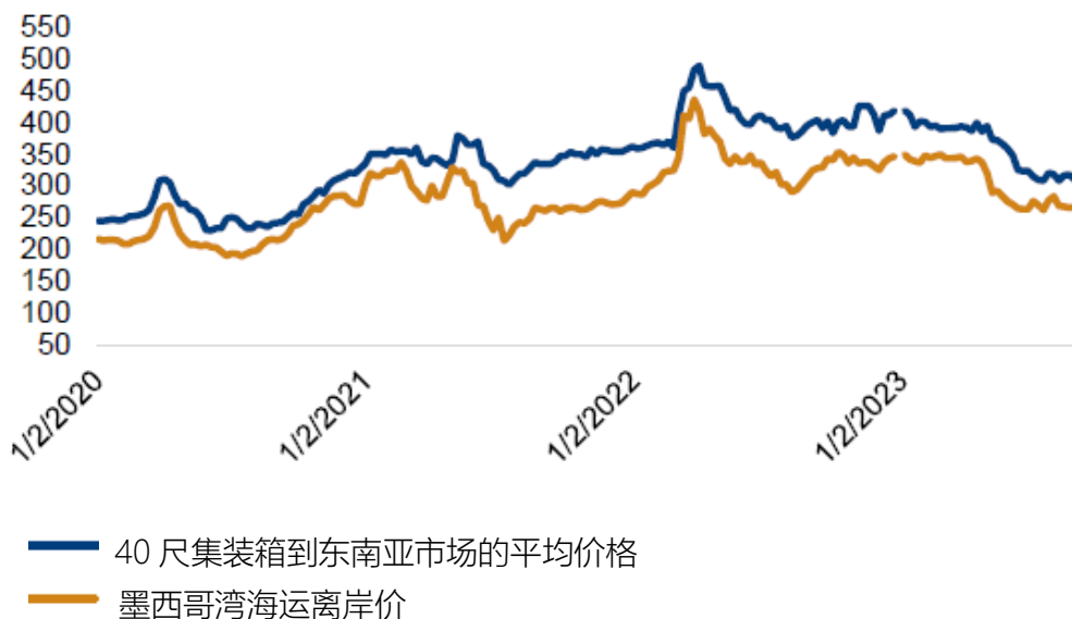
DDGS 价格：墨西哥湾离岸价和 40 尺集装箱到东南亚的价格（美元/吨）

驳船运输到新奥尔良港的到岸价本周涨跌不一，运费坚挺且需求增加，现货报价上涨了 2 美元/吨，而后续月份的报价有小幅下跌。本周新奥尔良港的离岸价出现同样的变化，9 月份的平均报价上涨了 1 美元/吨至 266 美元/吨。本周美国铁路运输的 DDGS 报价上涨了 3-4 美元/吨，而现货及 9 月份 40 尺集装箱到东南亚的报价下跌了 7 美元/吨，平均报价为 311 美元/吨。