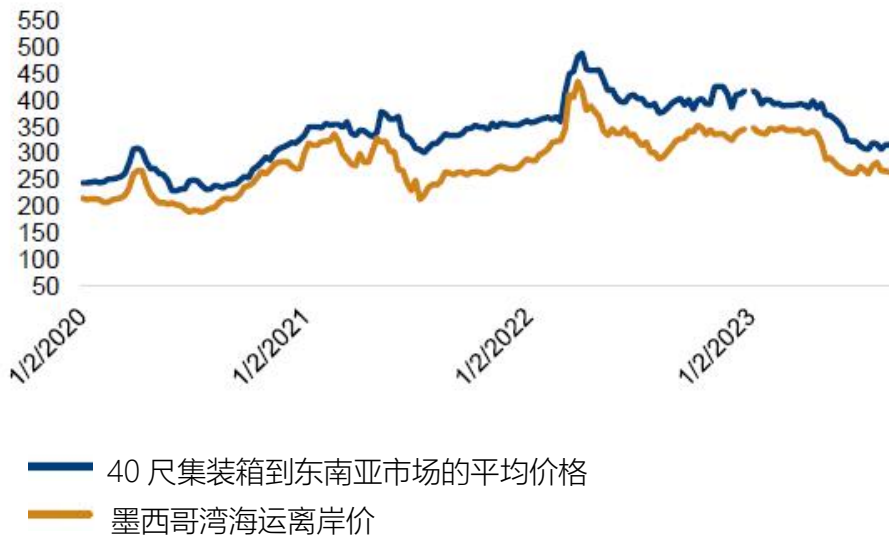
DDGS 价格：墨西哥湾离岸价和 40 尺集装箱到东南亚的价格 (美元/吨)

铁路运输到美国重要地区的 DDGS 价格本周上涨了 3-4 美元/吨，在新作粮食和油菜籽的收获季节，燃料乙醇的副产品赢得了一席之地。驳船运输到新奥尔良港的到岸价本周上涨，由于密西西比河水位下降运费继续坚挺，现货和第四季度的报价上涨了 4-5 美元/吨。本周新奥尔良港的离岸价同样上涨，10 月份的报价上涨了 6 美元/吨至 272 美元/吨，而远期曲线比较水平。本周 40 尺集装箱到东南亚的现货报价下跌了 11 美元/吨，平均报价为 300 美元/吨，主要原因是远洋运费在下降。