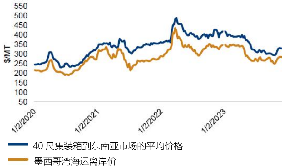
DDGS 价格：墨西哥湾离岸价和 40 尺集装箱到东南亚的价格（美元/吨）

的报价变化区间比较大。集装箱运输到东南亚的 DDGS 价格本周下跌了 2 美元/吨，12 月份和 1 月份的平均报价为 329 美元/吨，远洋运费的上涨抵销了内河运输价格的下跌。