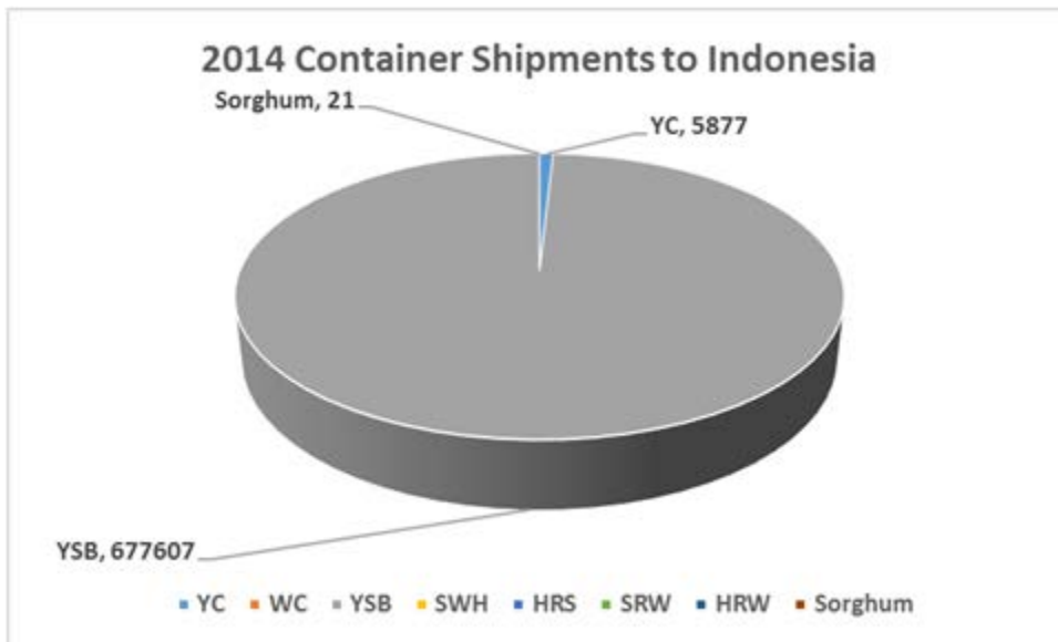
2014 年 1-12 月到印尼的集装箱运输情况